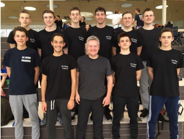
Die beiden DMS-Mannschaften der Schwimmer

5. April: Mitgliederversammlung im Vereinsheim