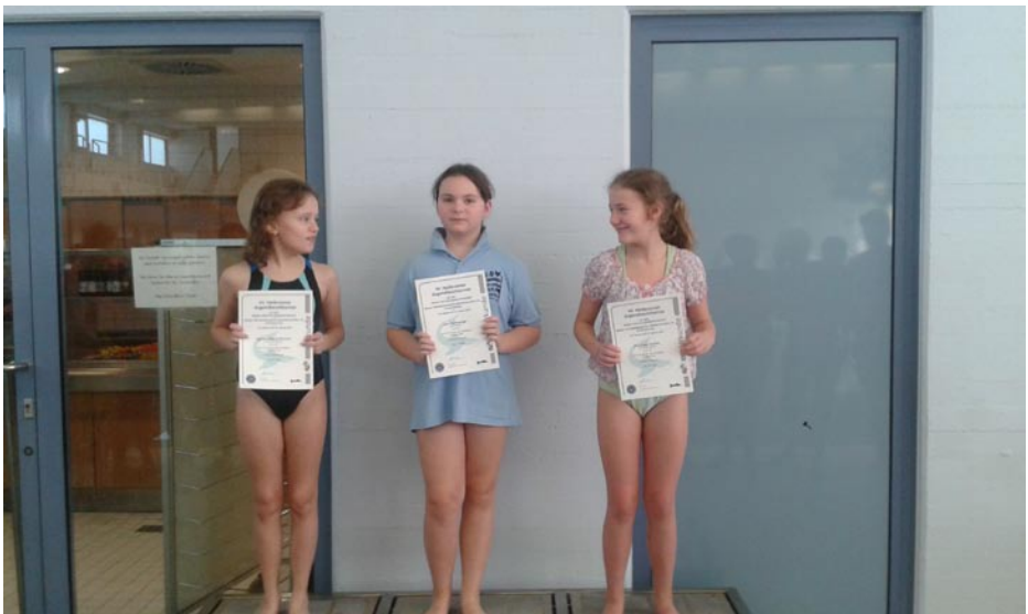
Mitte: Das Jüngste Mitglied unserer Mission